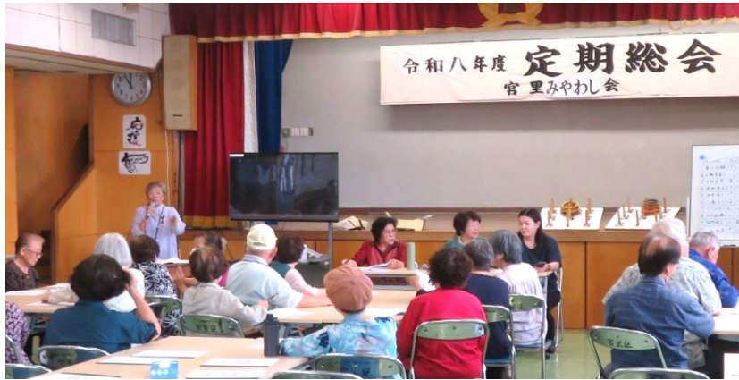
令和8年度宮里みやわし会定期総会【宮里公民館】