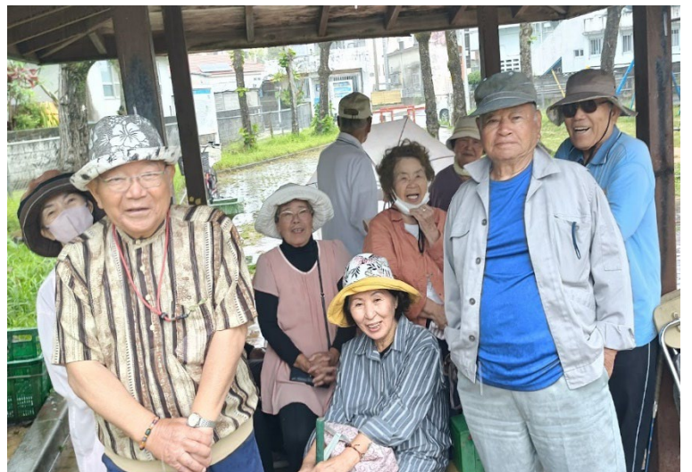
かたぶい！に閉じ込められた東屋も、また楽し【宮里公園】

5月16日の土曜日、宮里公園には15名が集まり、ゲートボールを楽しんでいました。9時半過ぎに試合開始。第2ゲート付近へボールが集まり始めたその時、突然の大粒の雨が。 「あれ？」と空を見上げた次の瞬間、バケツをひっくり返したような土砂降りに。ボールもそのままに皆さんが東屋へ一斉避難。普段はゆったりプレーする皆さんも、この時ばかりは見事な俊足。ちよつと早いような気もしますが、今年初めてのかた