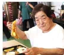
豪華な弁当とゆんたく を楽しむ皆さん