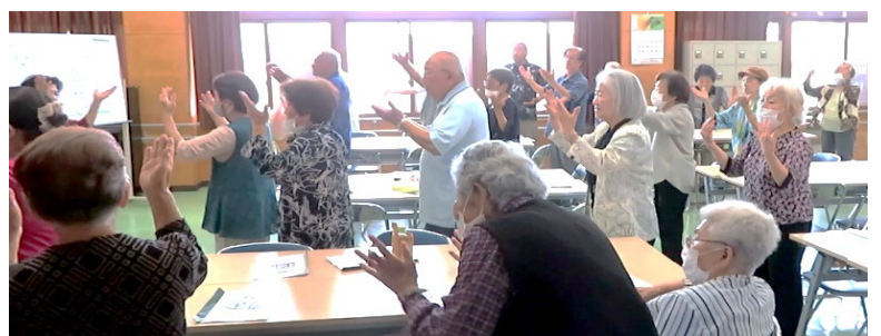
「肝ながさ節」で絆がまた深まっていく

総会後は豪華な弁当を囲んでゆんたくに花が咲き、「老人クラブの唄」の合唱や「肝ながさ節」の踊りで親交と交流を深めました。新年度の活動への期待と結束を感じさせる一日でした。